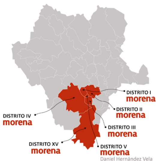
DISTRITOS IMPUGNADOS EN LA ELECCIÓN DE DIPUTADOS POR EL PRINCIPIO DE MAYORÍA RELATIVA (PROCESO ELECTORAL 2020-2021)

Por su parte, en la etapa de “resultados y declaración de validez de las elecciones”, se recibieron 7 juicios electorales, a efecto de impugnar los resultados consignados en las actas de cómputo distrital, efectuados por el Consejo Municipal electoral en Durango cabecera de los distritos electorales uninominales I, II, III, IV y V; así como el efectuado por el Consejo Municipal electoral en Nombre de Dios, Durango, cabecera del XV distrito electoral uninominal, en todos estos casos, el actor fue el partido Morena y en el distrito V además ocurrió el candidato de dicho partido en ese distrito.